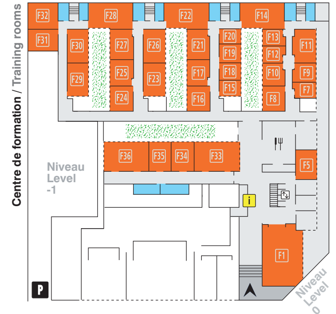
Plan des salles / Map of the rooms